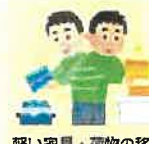
軽い家具・荷物の移動