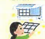
エアコンフィルター掃除